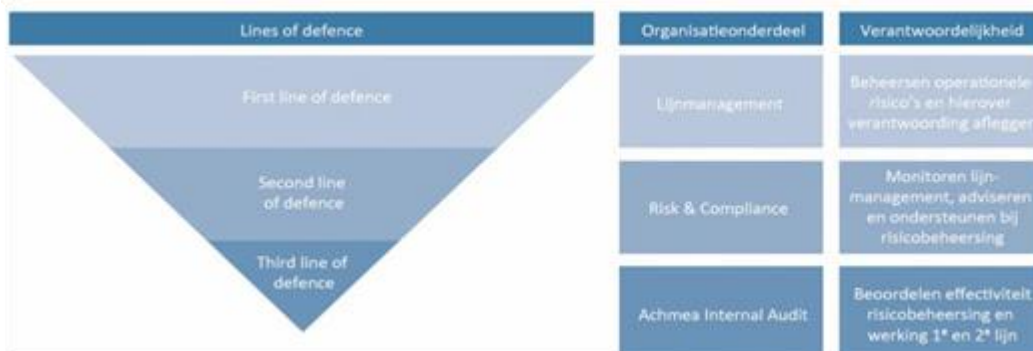
Figuur 12.1: Three Lines of Defence-model

De eerste verdedigingslinie betreft de lijnorganisatie die primair verantwoordelijk is voor het risicomanagement. Deze omvat de directie, lijnmanagement en medewerkers van Achmea IM. De directie is verantwoordelijk voor alle risicomanagement activiteiten, waarbij het lijnmanagement verantwoordelijk is voor de dagelijkse uitvoering van het risicomanagement en het waarborgen van risicobewustzijn, integriteit en ethisch gedrag.